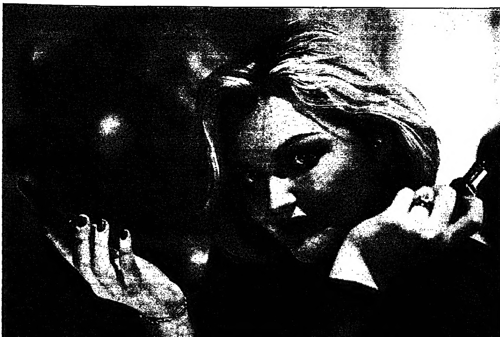
العارضة البريطانية صوفي دهل تتفقد مكياجها أمام عدسات المصورين أثناء افتتاح معرض للفنون المرئية اقيم في لندن مؤخرا.

فيما من ترصون على أيقاع طبولكم الشرقيه.. توقفوا قليلا.. ويا أبناء الديسكو.. توقفوا قليلا فالجنوب في عز رقصته.. وها هو الدم لا العرق يتخمد من الخاصرتين!